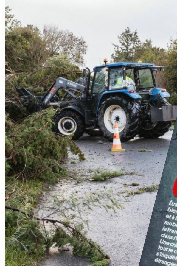
Après les tornades qui ont frappé l'Oise et Chambly en début de semaine, nous dirigeons-nous vers un scénario à l'américaine avec des bombes météo.

Climat Ces bombes météo qui balayent la France