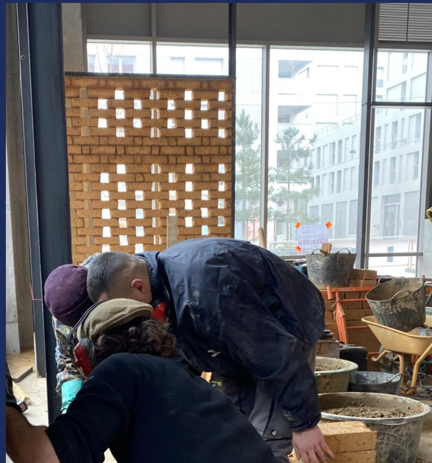
Installation d'un Moucharabieh en adobe – cave Chez Adrien - Rennes