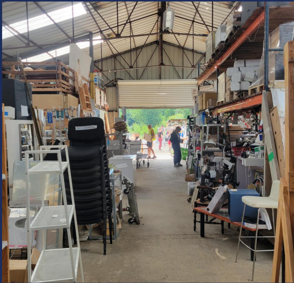
Photos internes de la Bricole Solidaire