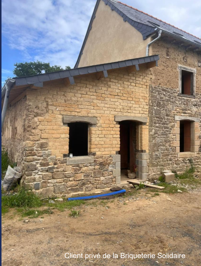
Client privé de la Briqueterie Solidaire