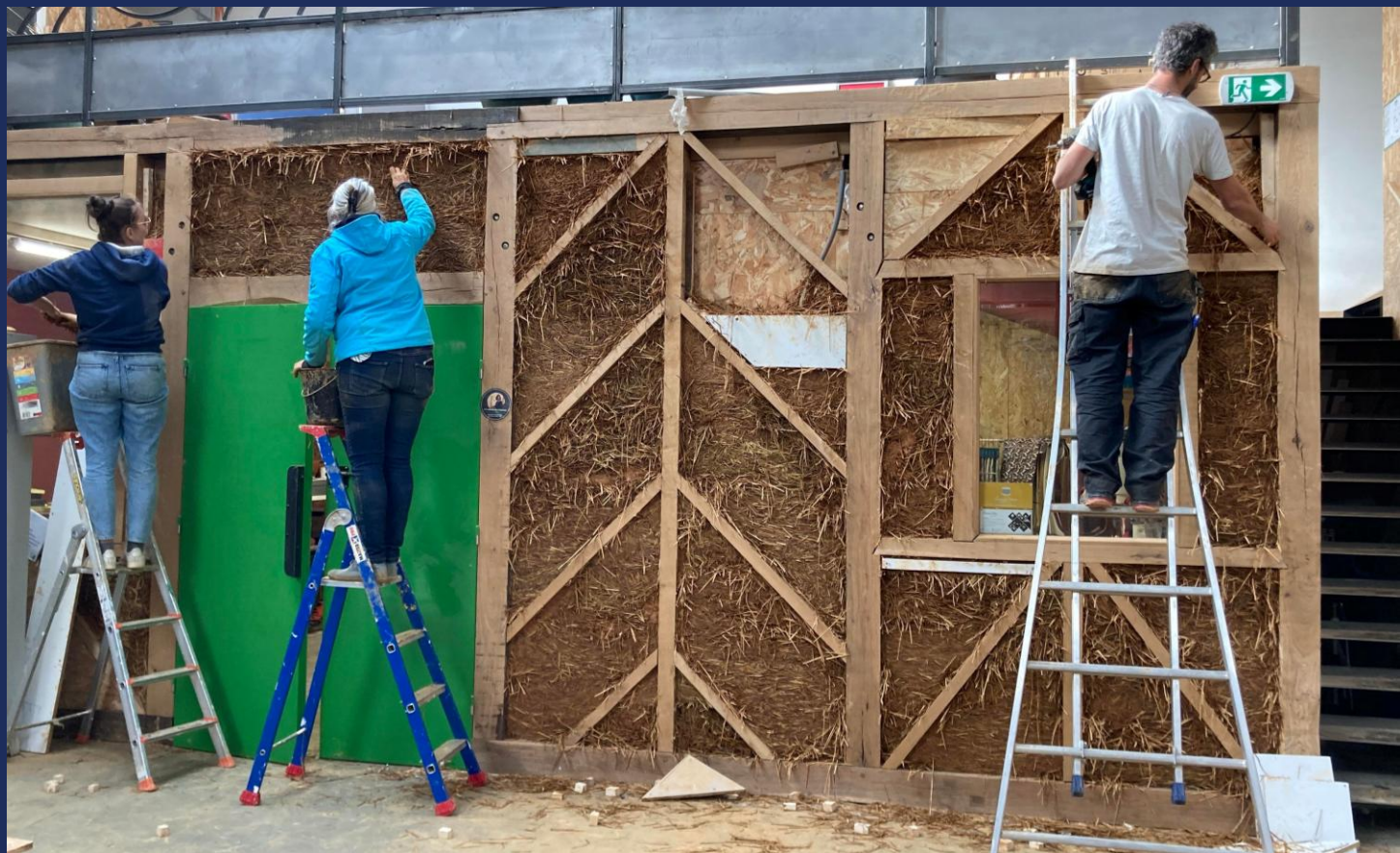
Formation et chantier participatif – Terre paille allégé – Comme un Établi – Rennes