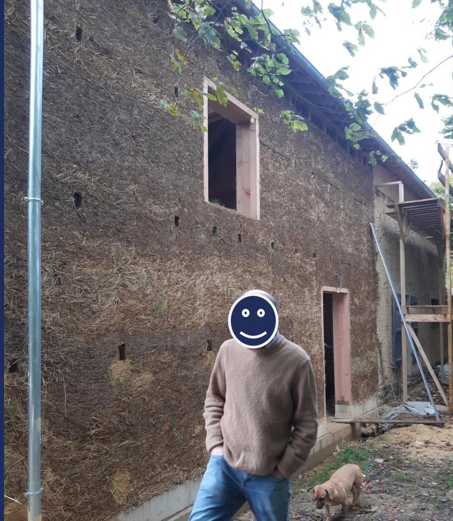
Maison neuve terre paille allégé - Chevaigné