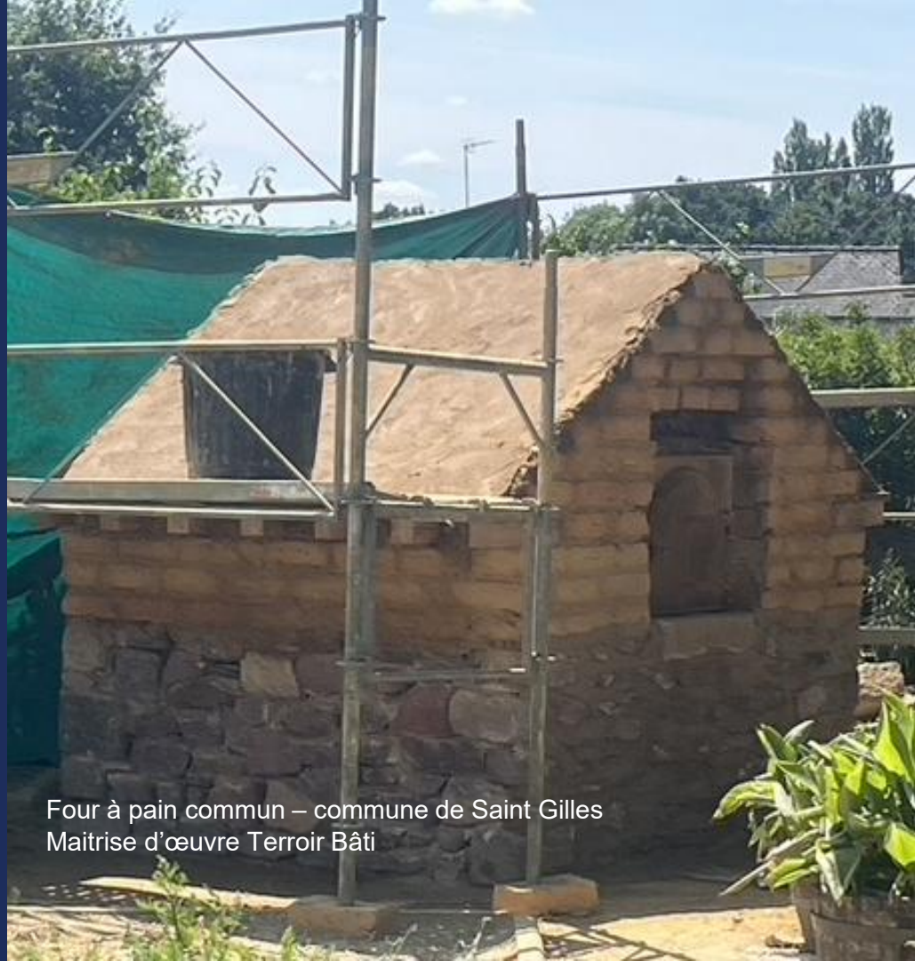
Four à pain commun – commune de Saint Gilles Maitrise d'œuvre Terroir Bâti