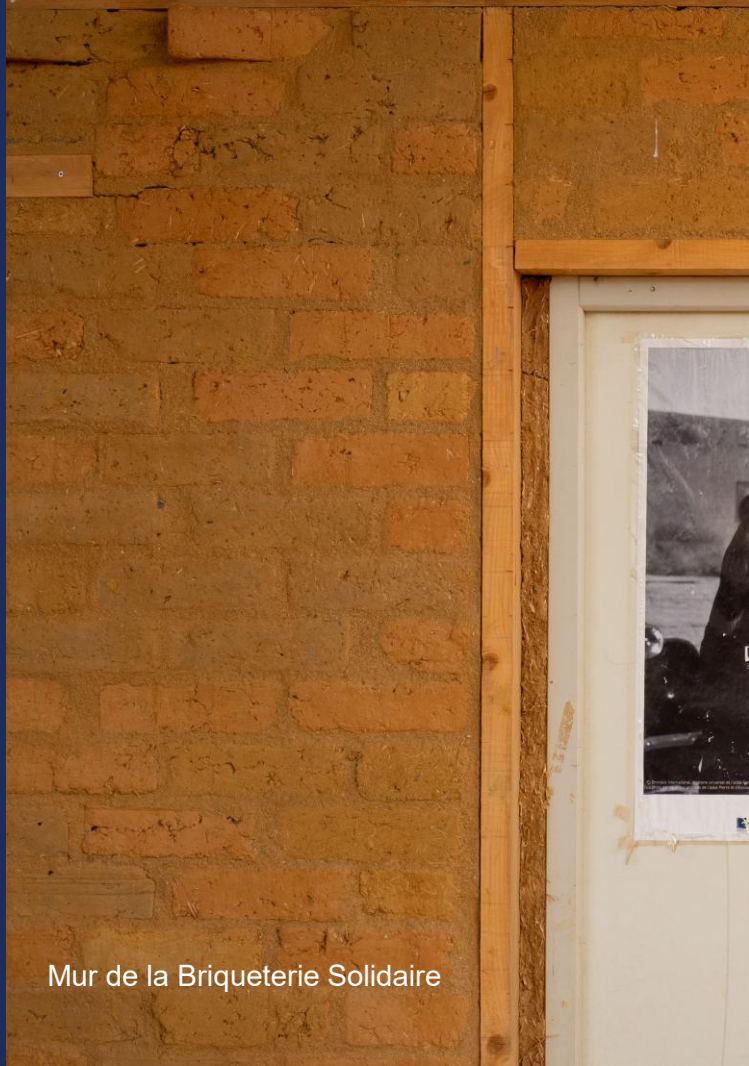
Mur de la Briqueterie Solidaire