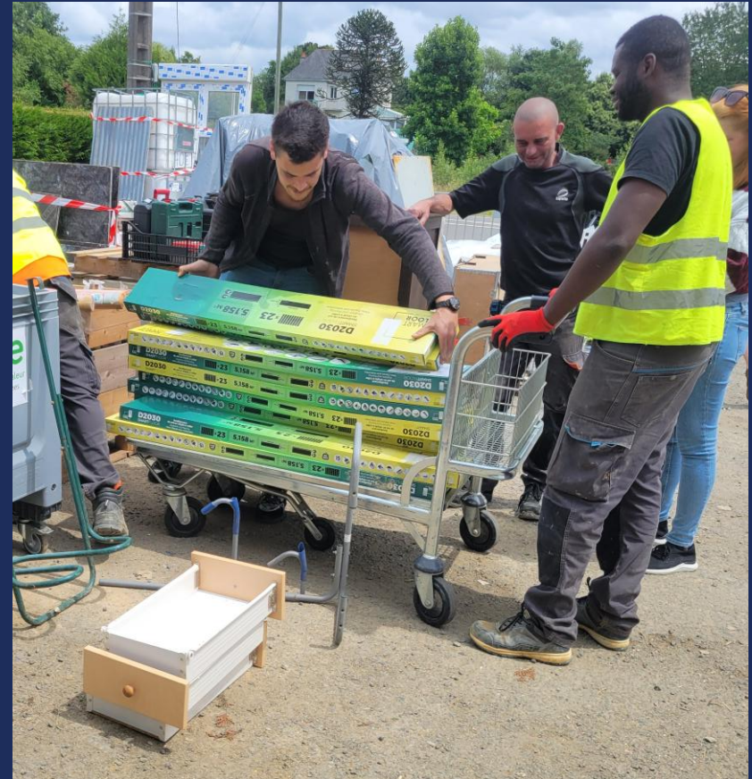
Récupération et vente de sols à la Bricole Solidaire