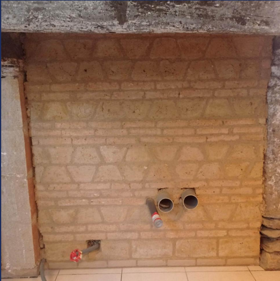
Murs à inertie - clients privés de la Briqueterie Solidaire