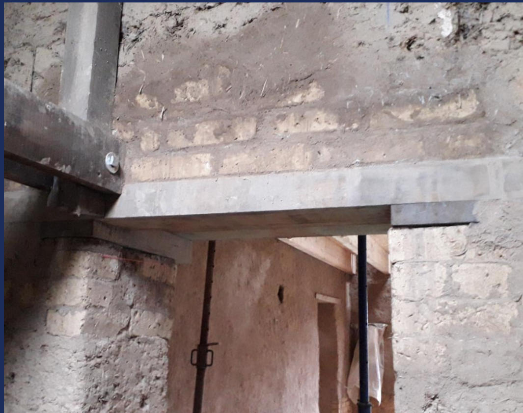
Reprise de charge - client privé de la Briqueterie Solidaire