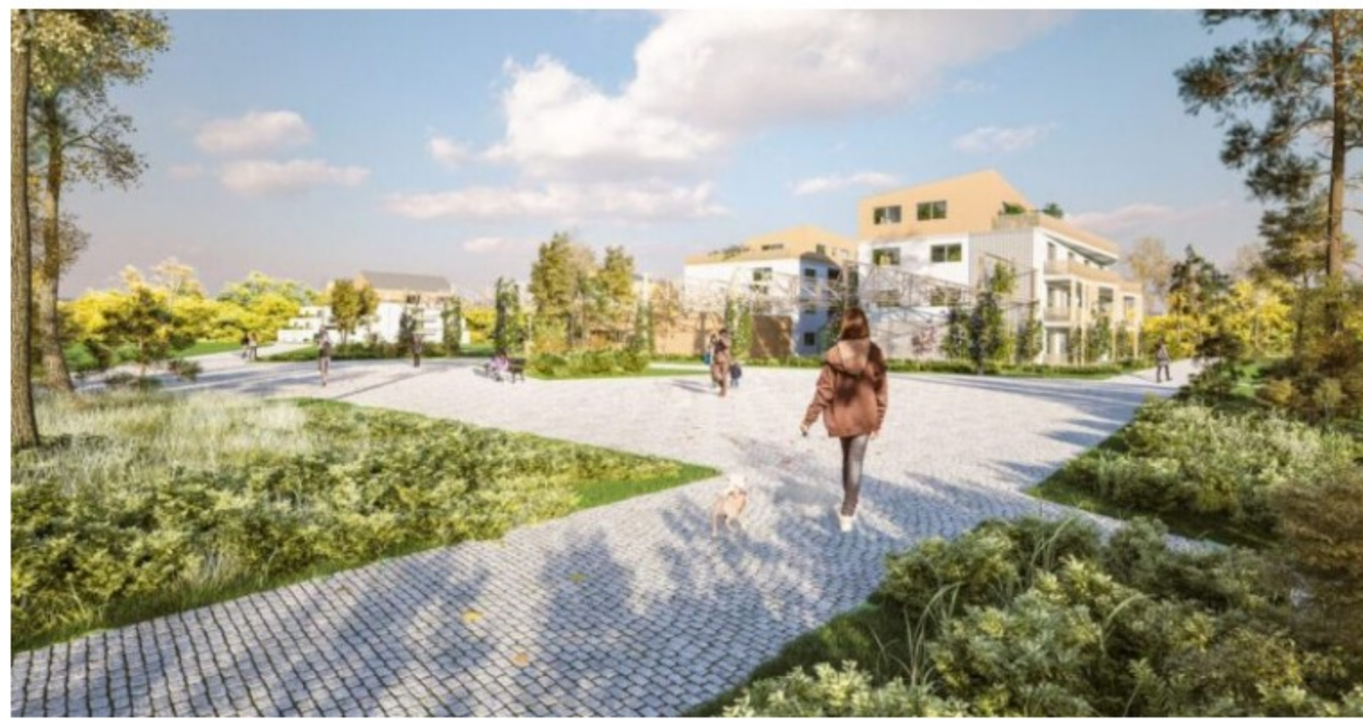
L'Eclasia parc, un projet de reconversion d'un lycée technique en quartier d'habitation qui devrait se concrétiser d'ici 2028 à La Roche-sur-Yon selon les principes régénératifs.

Le 17 novembre, le cluster des acteurs de la construction en Pays de la Loire Novabuild organisait le webinaire "adaptation et résilience des territoires : vers des projets régénératifs". L'occasion de découvrir les principes de l'économie régénérative, les objectifs du projet Regenerate[1] porté par Open Lande, et de bénéficier du retour d'expérience de l'architecte et urbaniste Marika Frenette.