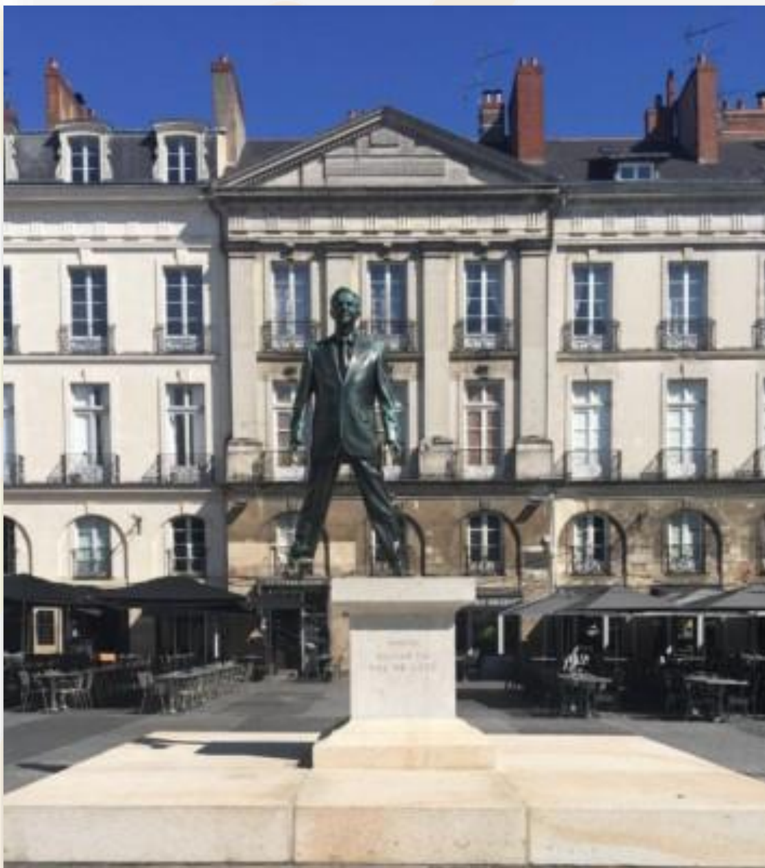
Le Pas de côté