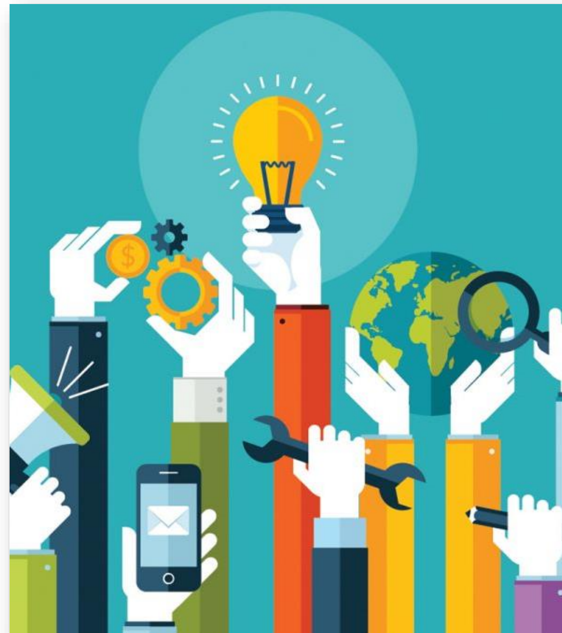
Seul on va plus vite, ensemble on va plus loin