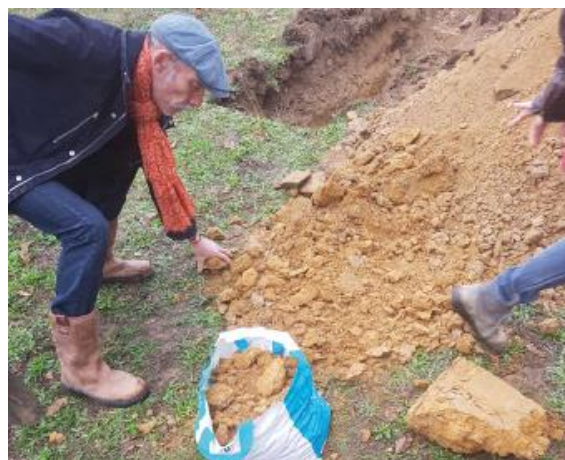
Récupération de la terre crue

Crédit architectes et illustrations : ATELIER DRODELLOT Architectes Sources : ATELIER DRODELLOT Architectes & KYSELI